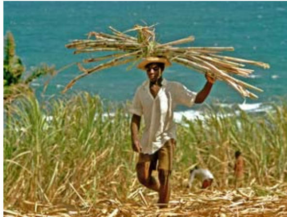
• Guadeloupe : la canne à sucre, une richesse en péril

En ce moment sur la rubrique Environnement