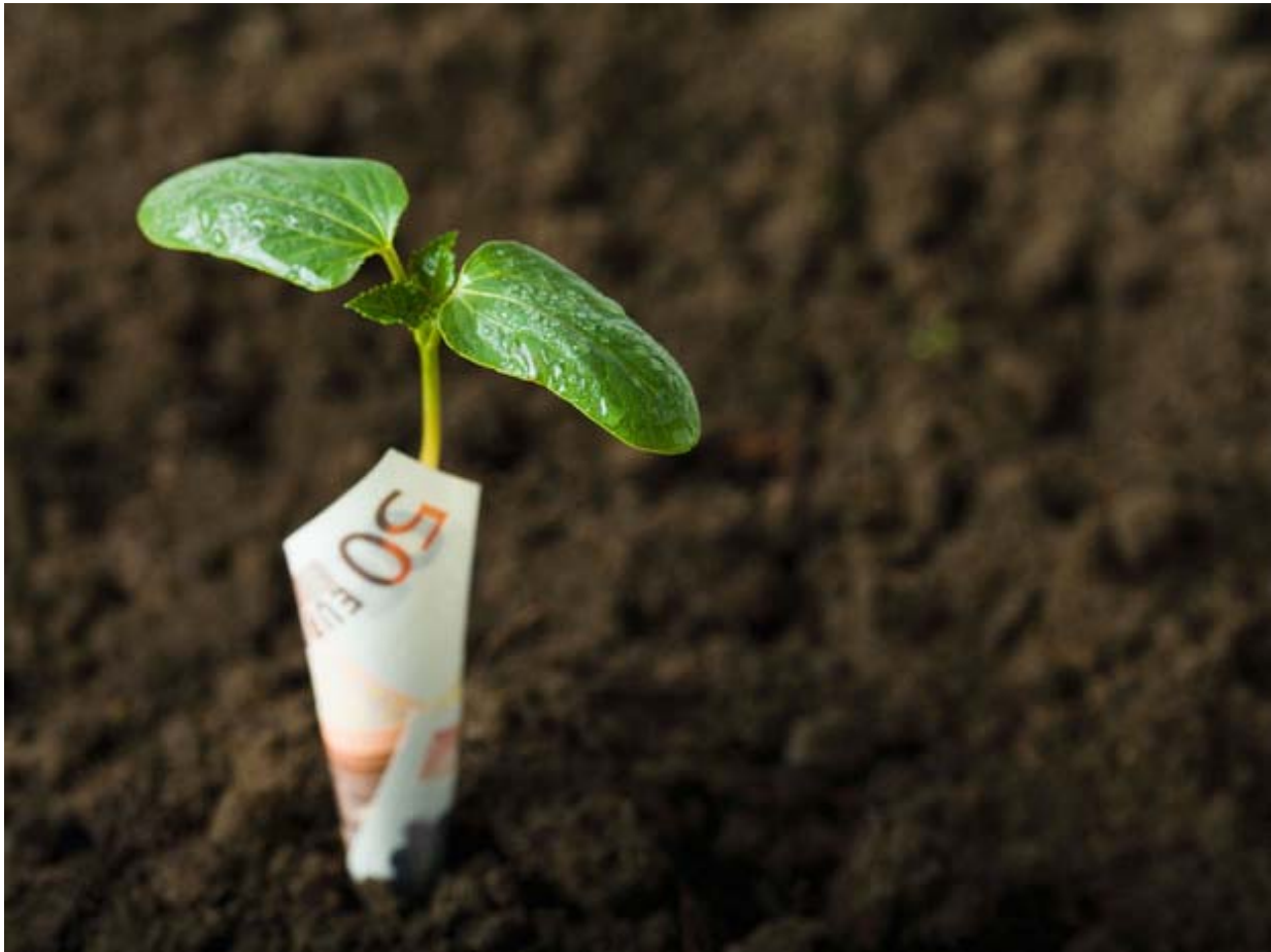
Plante et billet

L'actu : plusieurs organismes bancaires français proposent à leur clients des placements solidaires dans des projets environnementaux, sociaux et culturels. Dans un contexte de crise économique mondiale, cette offre alternative attire de plus en plus les entreprises et les particuliers.