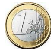
Eco-prêt logement social et Grenelle de l'environnement

Eco-prêt logement social et Grenelle de l'environnement. Jean-Louis Borloo, ministre de l'environnement et Augustin de Romanet, directeur général de la Caisse des Dépôts, ont signé une convention de mise en œuvre de l'éco-prêt logement social issu du Grenelle de l'environnement.