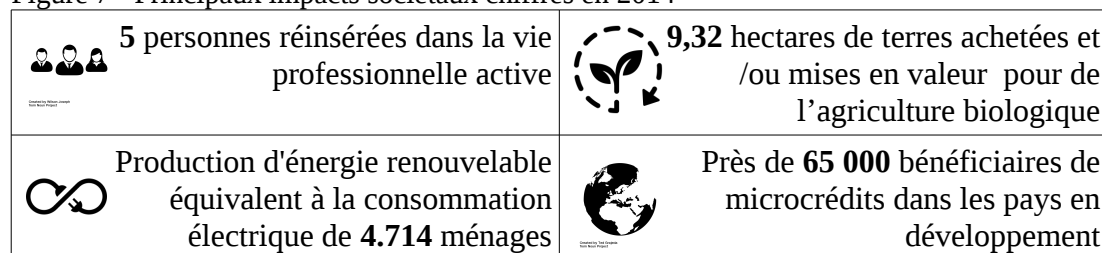
Figure 7 - Principaux impacts sociétaux chiffrés en 2014

Par ailleurs, concernant les impacts sociétaux, sur les 12 organisations ayant un produit financier labellisé, cinq d'entre elles sont en mesure d'annoncer des impacts chiffrés qui sont résumés ci-dessous. Ainsi, les coopératives Terre-en-vue et Agricovert ont permis la réinsertion au monde du travail de 5 personnes. De même, Terre-en-vue et Vert d'Iris International ont transformés 9,32 hectares de terrains, ruraux et urbains, en terres cultivées pour de l'agriculture biologique. Les coopératives Courant d'Air et Émissions Zéro produisent ensemble 16.500 MWh d'énergies renouvelable, soit de quoi alimenter 4,700 ménages moyens belges 2 . Enfin, Alterfin finance près de 65.000 personnes grâce à des microcrédits dans les pays en développement. Alterfin, qui est le « poids lourd » des coopératives ayant des produits labellisés, met en avant aussi d'autres impacts significatifs tels que les terres cultivées durablement (441 000 hectares) ou le montant des ventes certifiées commerce équitable et/ou issues de l'agriculture biologique (296,67 millions d'euros).