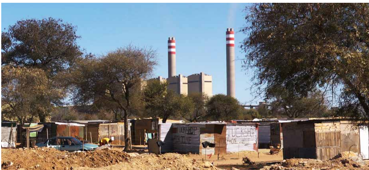
Bidonville informel à Exxaroland devant la centrale de Matimba

Si les retombées économiques sont accaparées par une minorité, les conséquences environnementales et sanitaires sont quand à elles partagées par tous.