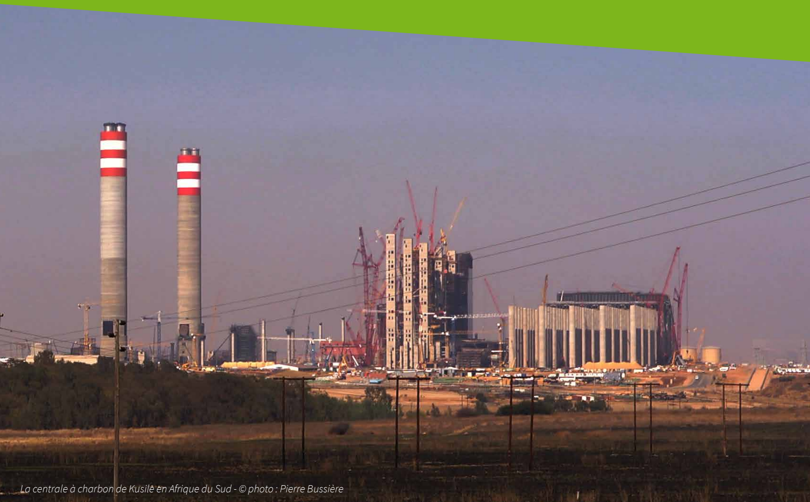
La centrale à charbon de Kusiile en Afrique du Sud