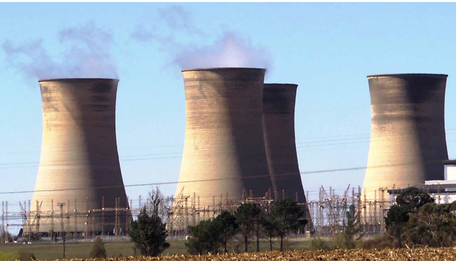
Une des 12 centrales à charbon d'Eskom dans la province de Mpumalanga, en Afrique du Sud- © photo : Pierre Bussière