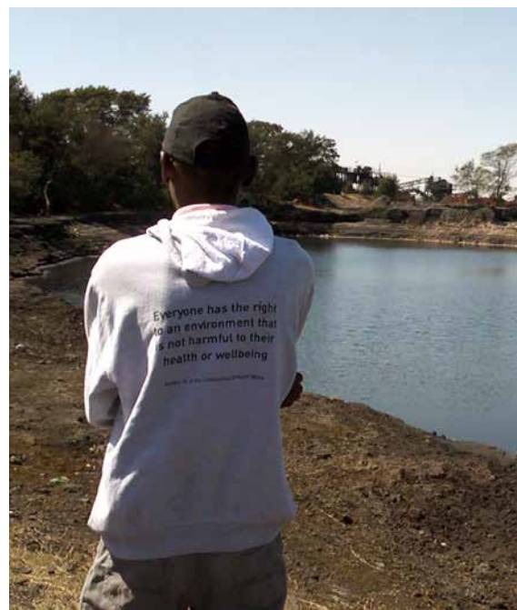
Un militant devant un étang rempli d'eau acide issue des mines de charbon

Pour qu'en Afrique du Sud, comme ailleurs, le CCS ne soit plus brandi comme excuse pour ne pas changer radicalement le modèle énergétique, les banques doivent supprimer ce critère de leur financement. A l'inverse, elles doivent surtout prendre en comptes les conséquences environnementales et sanitaires réelles liées au développement de centrales à charbon.